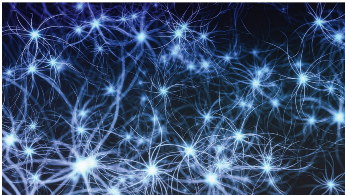
Künstliche neuronale Netze zeichnen sich durch Anpassungsfähigkeit aus. Sie modifizieren sich selbst, während sie aus dem anfänglichen Training lernen. Nachfolgende Durchläufe liefern mehr Informationen.

(KUK) Linz und das auf künstliche Intelligenz spezialisierte Unternehmen Five Square.